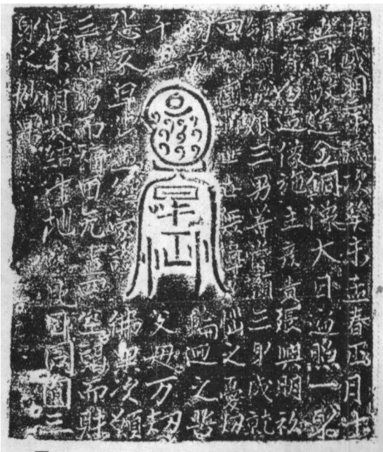
图一 大理国大日如来像内腔铸发愿文题记拓本

此大日如来像的内体中空,内腔在脖颈一周有三个半圆形的小环,当为悬挂经咒一类物品用。像的内腔铸有大理国盛明二年造