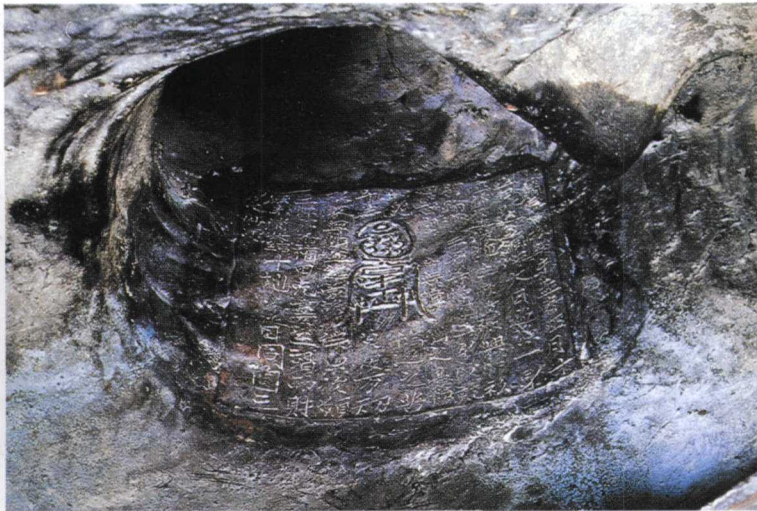
2.像内腔铸发愿题记