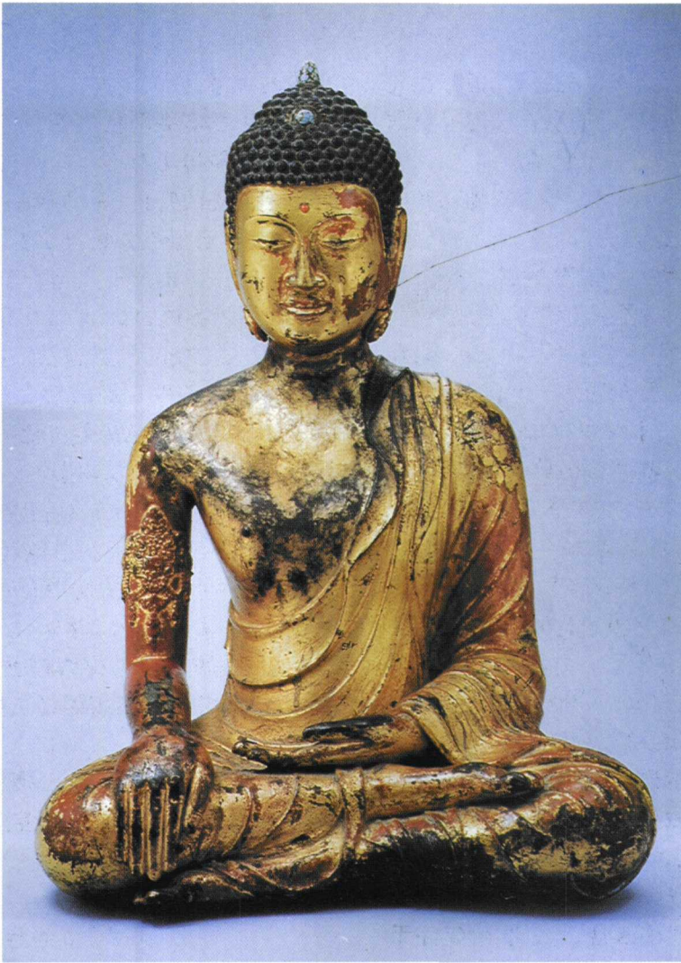
1.大理国大日如来鎏金铜佛像